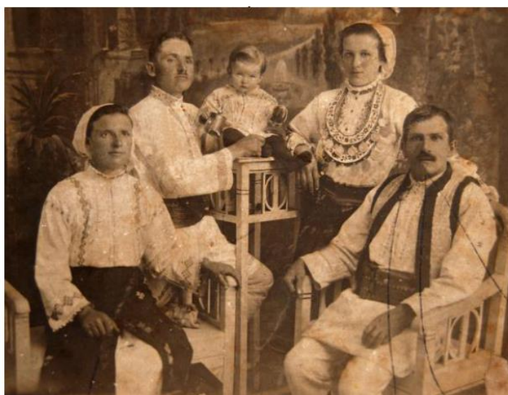
Anexa Dorna, purtând asemenea celor