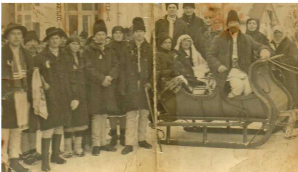
Anexa 2: Pregătiri de sărbătorile de iarnă