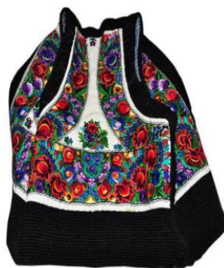
Anexa 1: Bondiță din cadrul patrimoniul Muzeului de Etnografie Vatra Dornei