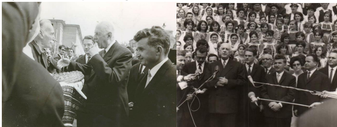
Fig. 7 Pâine și sare pentru Charles de Gaulle la Pitești Fig. 8 Entuziasm în reședința Argeșului

primească pe înaltul oaspete, adolescenți îmbrăcați îngrijit și în conformitate cu regulamentul de educație al vremii, băieții, fără plete și în costum de culoare închisă, fetele cu sarafan bleumarin, cămașă bleu, bentiță albă pe cap, toți cu emblema cu numărul matricol pe mânecă. Eleva a susținut în fața președintelui Charles de Gaulle un discurs în limba franceză, care se referea la extraordinara carieră de politician și militar și strălucita semnificație a vizitei sale în România și în capitala de județ a Argeșului. Președintele Charles de Gaulle a lăudat forma și fondul momentului, conținutul textului, elocința vorbirii elevei și rostirea perfectă în franceză.