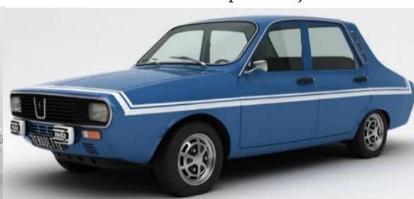
Fig. 14 Renault 12