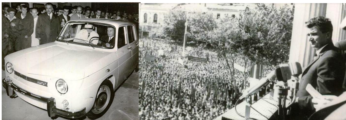
Fig. 11 Ceaușescu, la inaugurarea Uzinei Dacia; Fig. 12 Condamnând invazia sovietică în Cehoslovacia

20 august 1968. Primul Renault 8-Dacia 1100 de control a fost finalizat cu succes la Colibași, iar Nicolae Ceaușescu, Ion Gheorghe Maurer, Ilie Verdeț și Manea Mănescu au ajuns după două săptămâni la Uzina de Autoturisme. Secretarul general al C.C. al P.C.R a primit cheile de la întâiul autoturism, în care s-a urcat la volan, deși nu știa să conducă. Mașina avea aplicată o plachetă din bronz pe care scria: „Primul autoturism de serie fabricat în RSR. Muncitorii, inginerii și tehnicienii constructori de mașini vă aduc dumneavoastră, tovarășe Nicolae Ceaușescu, prinosul de recunoștință pentru inițierea producției de autoturisme în România și pentru grija permanentă ce o purtați dezvoltării industriei noastre socialiste” 21 .