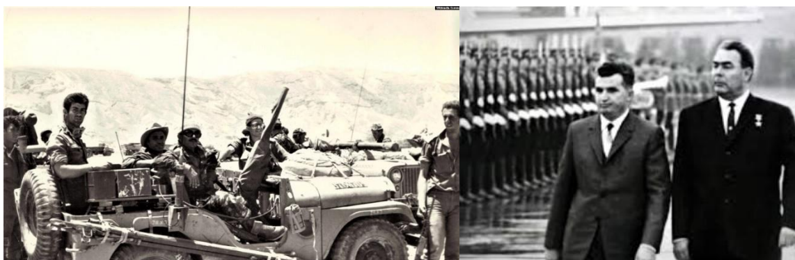
Fig. 5 Războiul de 6 zile; militari israelieni în acțiune Fig. 6 Nicolae Ceaușescu și Leonid Brejnev

cu politica dusă de către Uniunea Sovietică în acest spațiu” 9 . O poziție clară de nesubordonare față de Uniunea Sovietică, care nu a afectat colaborarea cu China și a strâns mult relațiile cu Iran și cu Statele Unite, americanii salutând cu multă satisfacție noua dovadă de independență a României 10 . Din acel moment, liderul sovietic Leonid Brejnev l-a criticat public și i-a reproșat și personal lui Ceaușescu pentru decizia față de conflictul din Orientul Mijlociu, în discordanță cu politica U.R.S.S. și a celorlalte state comuniste.