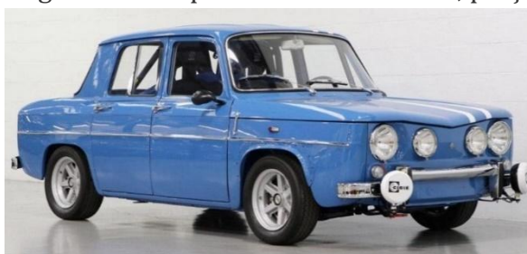
Fig. 13 Renault 8

Autoturismul a fost construit din piesele trimise de compania „Renault” la Uzina de Autoturisme din Argeș, situată la 20 de kilometri de Pitești, în condițiile în care România nu începuse producția componentelor necesare automobilului. Dacia 1100 avea un preț mare, costa 55.000 de lei, iar în cei patru ani în care a fost fabricată, din 1968 până în 1972, au fost înregistrate peste 37.500 de automobile. Dacia 1300 era și mai greu de cumpărat de către români, prețul fiind de 70.000 de lei per mașină 25 .