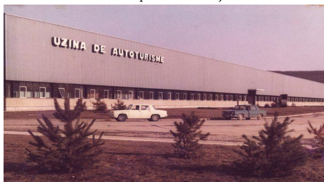
Fig. 1 Fabrica de automobile de la Colibași, județul Argeș, în 1968

Ulterior, evenimentele sociale din capitala Franței s-au mai calmat, dar revoltele studenților și muncitorilor din mai 1968 i-au provocat un insucces major la referendumul din 28 aprilie 1969, care viza reorganizarea regională și reforma Senatului, situație în care generalul a demisionat din funcție, fiind înlocuit de Georges Pompidou. De Gaulle a revenit în Colombey-les-deux-Eglises, o situație total neașteptată, la mai puțin de un an după triumfalista vizită în România, care a creat iluzia că președintele, deși avea aproape 80 de ani, era în plină activitate, nicidecum la final de carieră politică. S-a dedicat din nou scrisului memoriilor, dar la ora 19:10, în ziua de 9 noiembrie 1970, suferă o ruptură de anevrism și după 20 de minute, moare, deced care lăsa Franța fără una dintre cele mai mari personalități din istoria sa.