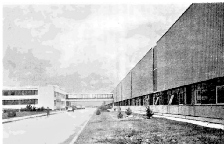
Fig. 4 Uzina de Autoturisme, hala monobloc și anexă socială

În iunie 1967, cu ocazia vizitei delegației de partid și de stat în Regiunea Argeș, condusă de Nicolae Ceaușescu, la Uzina de Piese Auto Colibași, se fixează amplasarea lângă aceasta a Uzinei de Autoturisme, avându-se în vedere viitoarea cooperare dintre acestea, forța de muncă suficientă și cu mare experiență de la unitatea existentă 6 . Inițial s-a preconizat că inaugurarea fabricii de automobile va fi în 1969, dar buna organizare de șantier și ritmul susținut de lucru au determinat grăbirea finalizării investiției după numai un an și jumătate. Astfel, la 1 iulie 1968, au început probele de funcționare în gol a utilajelor și instalațiilor, iar în 3 august, după parcurgerea celor 217 posturi de lucru ale liniilor de asamblare caroserie, protecție anticorozivă, vopsitorie și montaj general, primul autoturism de control ieșea din hală. Urma inaugurarea oficială a fabricii, pe 20 august, la numai un an și două luni după hotărârea definitivă de amplasare a unității, din 10-12 iunie 1967.