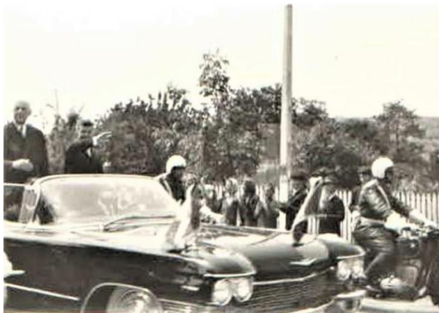
Fig. 9 În celebrul Cadillac decapotabil, spre Micești

fiind rechemat în țară de la postul diplomatic în anul 1969. El și colegii săi, cu excepția dezertorului Iacobescu, adjunctul său, au revenit la București fără a fi declarați „persona non grata” de guvernul francez 19 . Timp de 11 ani, NATO a fost penetrată sistematic, zeci de informații ultrasecrete ajungând astfel la dispoziția Moscovei, Mihai Caraman reușind cea mai mare lovitură dată Organizației Nord-Atlantice.