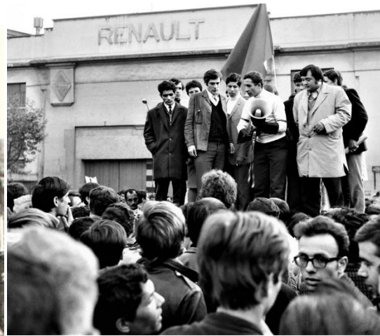
Fig. 10 În același timp, proteste în Franța Sursa Fig.10:

https://moldova.europalibera.org/a/sf%C3%A2r%C8%99it-de-mai-ro%C8%99u-o-istorie-a-revolu%C8%9Biei-studen%C8%9Be%C8%99ti-din-fran%C8%9Ba-68-(video)/29263904.html